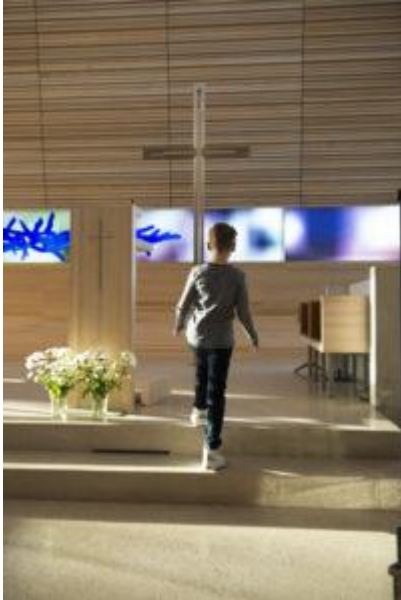
Barna er en del av gudstjenesten.