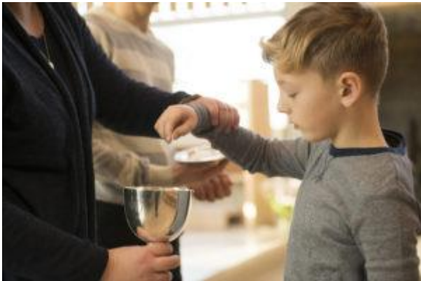
Hjelp til nattverd

Det å tilrettelegge for synshemmede kan deles inn i to stadier: universell utforming og individuell tilrettelegging.