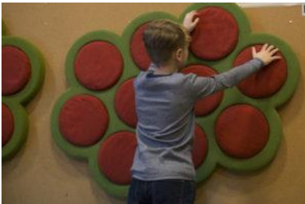
Barn trenger noe å kjenne på.