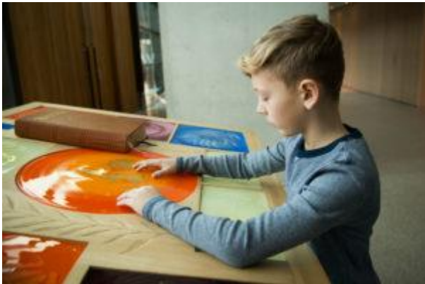
Gutt som føler med hendene.

Begreper dannes ut fra måten vi sanser på. Det gjelder både konkrete objekter, og abstrakte begreper.