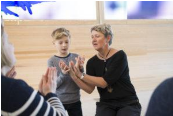
Fellessang i kirke.