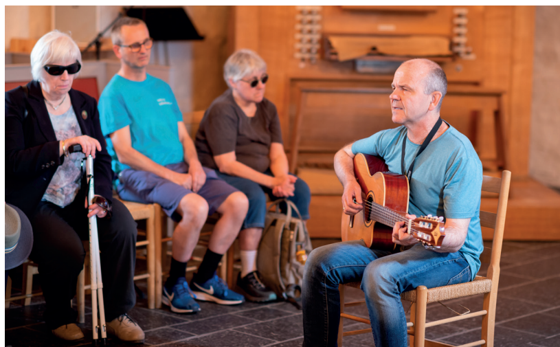
KABB tilrettelegger trygge arenaer og møteplasser for synshemmede og personer med leseutfordringer.