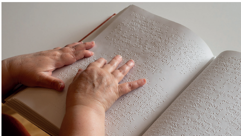
En tilrettelagt salmebok i punktskrift gjør at flere får være med i sangen i kirken.

Det er mange organisasjoner og gode tiltak som ber om penger og støtte. Men vi trenger fremdeles en heiagjeng som ser at KABB gjør et unikt arbeid for mange mennesker som lett blir glemt og glemte.